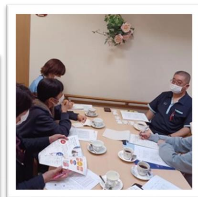
小規模多機能アイリーフ八幡の里