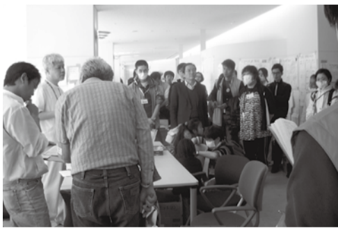
坂総合病院でのミーティング

紙面のご案内 2面…組合員の輪/新歯科建設に向けて/夏休み親子歯科教室/健康講演会のご案内 3面…シャレードけんこうチャレンジ/医療福祉生協連の通信教育のご案内/2011ピロシマ