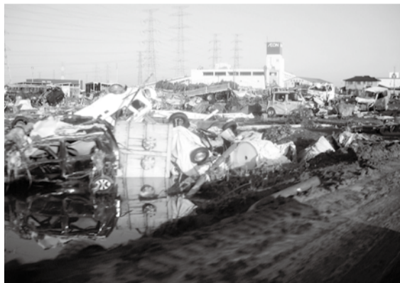
宮城県多賀城駅周辺