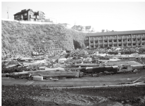
高台の家との被害の違い

まだまだ多くの問題を抱えている被災地も広域に渡っており、今後も状況に合わせた長期的な支援継続が必要と思われる。2か月も