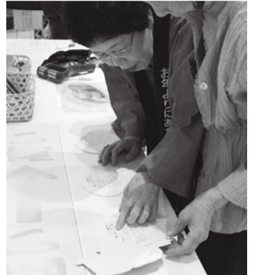
カロリー並び替えクイズに興味津々

健康チェックに訪れた方は197名と、測定者の方から嬉しい悲鳴が聞こえてきそうなほどでした。食事に関する並び替えクイズは、焼きそばや焼き飯など普段口にする料理をカロリー順に並び替えるというものでしたが、正解を聞いてビックリする方も大勢いました。WHO世界禁煙デーにちなんで禁煙に関する資料を用意しましたが、「家族も吸ってないので大丈夫」と言われるかたが多く、「無煙社会」がすすみつつあるようでした。