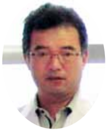
生協歯科ひろしま