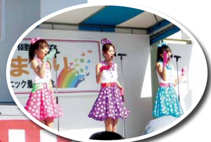
まなみのりさライブでは大盛り上がり