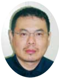
コープ五日市診療所

用者に寄り添い、デュエットするように、その人らしい生活を貫けるようなかわりをもてる様に私たち自身の力量をつけていきたいと思っています。いつも地域で活動していただいている組合員の方に感謝いたします。草津診療所の周辺では高齢化が進む一方でマンション建設が続き新しい住民が増えています。高齢者に優しい、子供に優しい、人に優しいすみやすいまちを目指してともに活動して行きましょう。本年もよろしく願います。