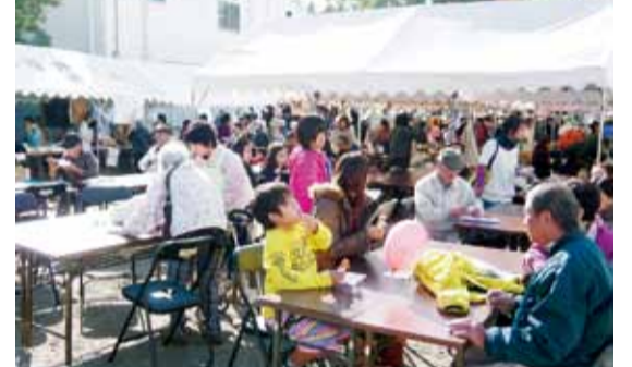
食ブースでは完売が続出した

「生協けんこうプラザ」は12月5日に着工し、来年7月2日オープンが予定されています。ご協力頂きましたすべての組合員・地域住民・各団体の皆さま方に感謝申し上げます。 「生協けんこうプラザ」は12月5日に着工し、来年7月2日オープンが予定されています。ご協力頂きましたすべての組合員・地域住民・各団体の皆さま方に感謝申し上げます。