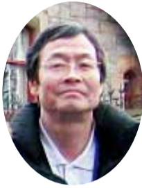
福島生協内科クリニック