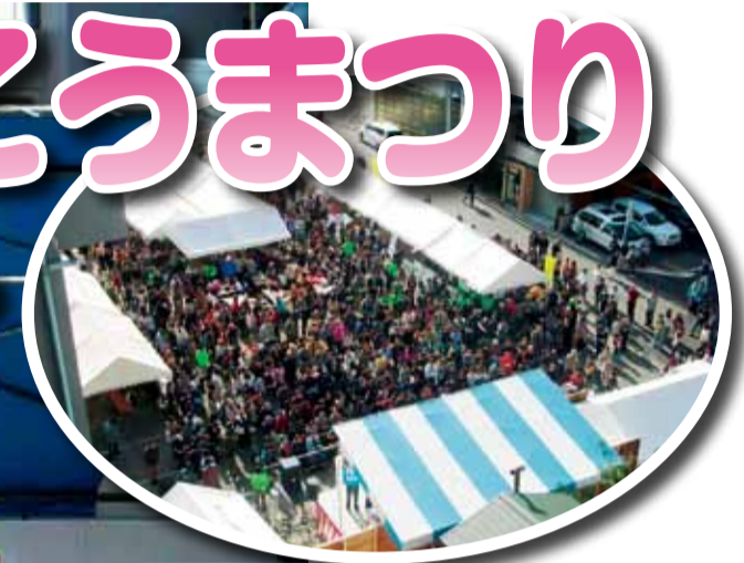
会場からあふれんばかりの人