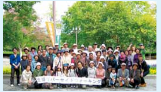
参加者みんなで記念撮影

10月23日(日)広島市を流れる本川の川べりにて「生協リバーサイドウォーキング2011」を開催しました。金曜日の夕方からは強い雨にみまわれ、どうなることかとヒヤヒヤしながら当日を迎えましたが、みんなの願いが届き絶好のウォーキング日和になりました。