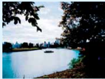
銀賞 「遊覧船からの広島は？」