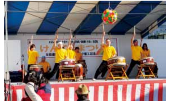
オープニングを飾ったのはポンポコ座

協内科クリニック・福島生協病院の栄養科や検査科が健康に関する様々な催しを行った健康ラリー会場も同様に大賑わいでした。 ステージの方目目を向けると、「ポンポコ座」の和太鼓と獅子舞を皮切りに、マンドリン演奏や落語、チアリーディング、沖繩空手など素晴らしい演者が入れ替わり立ち代わり。舞台の目玉「まなみのりさ」のライブでは、多くの人々がステージ