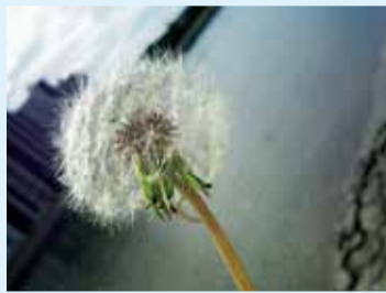
金賞 「またどこかで大きくな～れ」