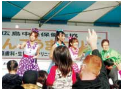
フィナーレはまなみのりさと餅まき

1週間前から雨予報にハラハラしながらも、当日は奇跡的に晴れに恵まれた11月20日(日)。建設予定地にて10時から14時で「広島中央保健生協けんこうまつり」生協歯科・生協内科クリニック「着工記念」を開催しました! 3,000人超の来場者でビル建設予定地の約400坪ある会場は人混みをかき分けて歩かなければならない状況でした。出店ブースは、お昼を迎えるころには「完売」の看板が出始め、用意した約3,600食は、まつりが終了するころにはほぼすべてのブースで完売となりました! キッズコーナーも子ども達でいっぱいになっていました! また、生協歯科・生