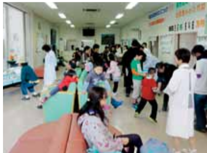
健康ラリー会場也大賑わい