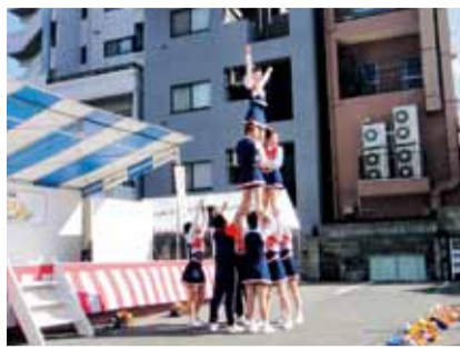
チアリーディングチーム GUTZ