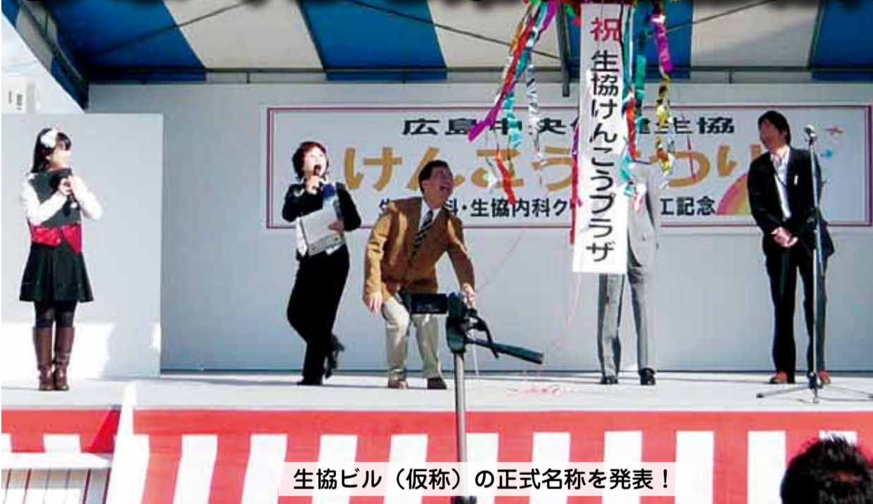
生協ビル（仮称）の正式名称を発表！