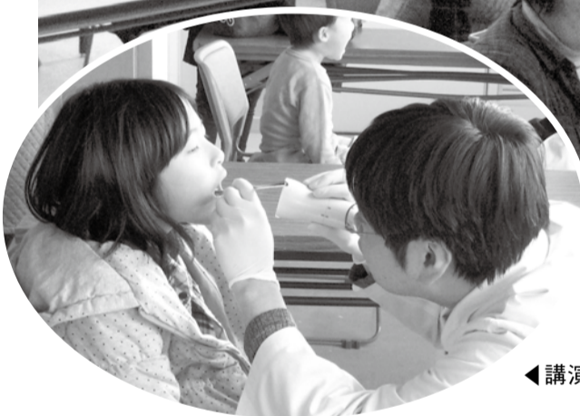
◀講演会後の子ども歯科相談

よる、無料子ども歯科相談を実施し、お口の健康チェックを行いました。 参加者からの感想より ○あれはダメ、これはダメと、やる前から止めてしまっている子どもを力を抑えてしまっているのかなと感じました。 ○子育てに正解や不正解はないのだと思いました。子どもと自分の関係でゆっくり進めていけば良いのだと思いました。