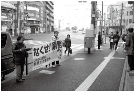
そごう前での様子