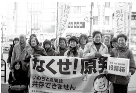
西広島駅前でのバレンタイン行動