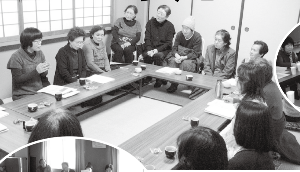
▲東区北支部 - 「くらしに役立つ制度」について学習しました。

今、地域では「7つの安心サポート講座」を開催しています。新しく組合員になられた方や広島中央保健生活協の活動に参加されたことのない方などを誘って多彩に取り組みをしましょう。今回は中広支部で行われた取り組みを紹介いたします。