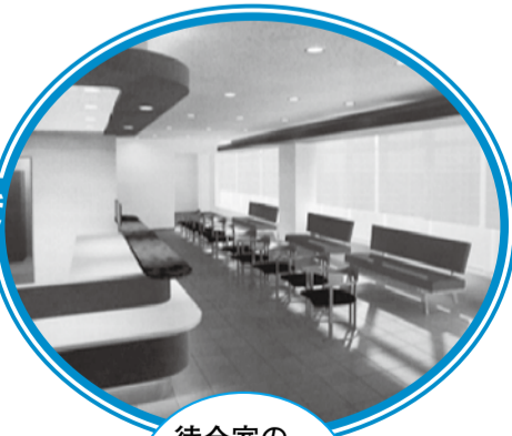
待合室のイメージ図です。