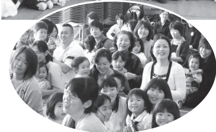
▲大人も子どもも集中して見えています

5月12日に子育て応援企画第2弾、たね工房さんによるペーパーシアター「はらぺこあおむし」の上演会が開催されました。事前申し込みの時点で100名を超え、当日は56世帯、総勢135名の参加となりました!