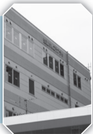
5/12現在 取囲って生協けんこうプラザの看板が取り付けられました。

3班に分かれ、工事担当の浅沼組のヘルメットを被って70名以上が見学しました。1階の歯科診療室は床下の配管工事の最中のために、中までは見学できませんでしたが、2階以上は全て見ることができました。「広いね」「窓からの景色も良いよ」との声。特に5階の大会議室は広々としており、明るく景色も良く、色々なことに大いに使えそうです。天井からはまだ、様々なものが工事中のために吊り下がっており、ヘルメットが無いと不安な状況でしたが、間仕切り等ができつつあり、この先の2か月が楽しみです。屋上にも上がりました。屋上はエアコンの室外機置き場にもなっているため、人が上られるスペースは広くありませんが、屋根の部分は広くて鉄板がぎとっています。ここには環境に配慮して太陽光発電パネルを設置することになっています。