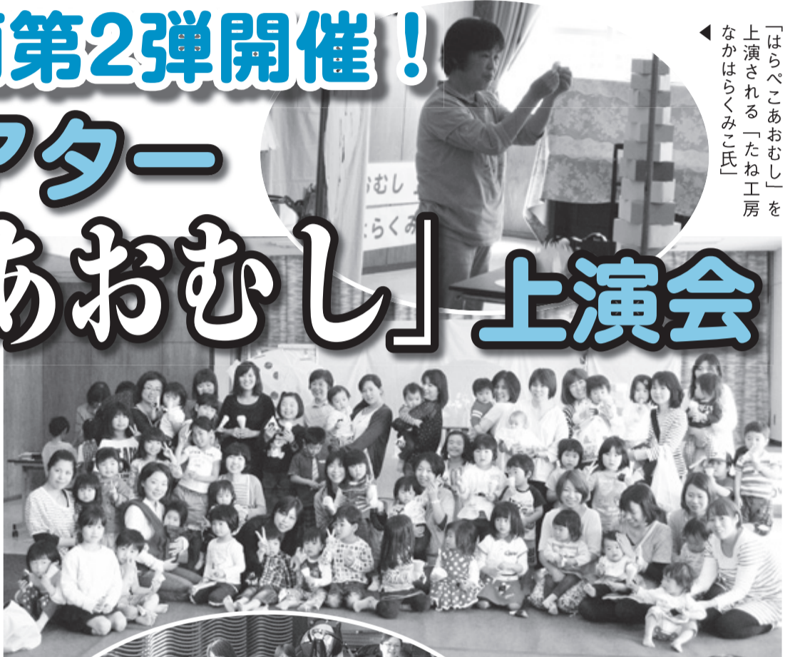
▲参加者で写真をパチリ