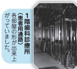
1階歯科診療所 (患者用通路) 各部屋の形が出来上がっていました。

3班に分かれ、工事担当の浅沼組のヘルメットを被って70名以上が見学しました。1階の歯科診療室は床下の配管工事の最中のために、中までは見学できませんでしたが、2階以上は全て見ることができました。「広いね」「窓からの景色も良いよ」との声。特に5階の大会議室は広々としており、明るく景色も良く、色々なことに大いに使えそうです。天井からはまだ、様々なものが工事中のために吊り下がっており、ヘルメットが無いと不安な状況でしたが、間仕切り等ができつつあり、この先の2か月が楽しみです。屋上にも上がりました。屋上はエアコンの室外機置き場にもなっているため、人が上られるスペースは広くありませんが、屋根の部分は広くて鉄板がぎとっています。ここには環境に配慮して太陽光発電パネルを設置することになっています。