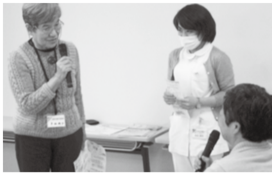
お手本訪問の様子