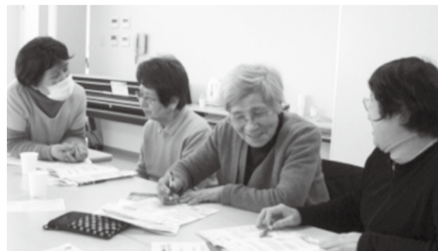
ペアを組んで模擬訪問

次回は4月6日(土) 13時30分～15時30分「みんなここまですべて前進!!あれこれ大報告会」です。いよいよ実施設計のスタートです。たくさんご参加頂き、たくさんアイデアをお寄せください。お待ちしております。