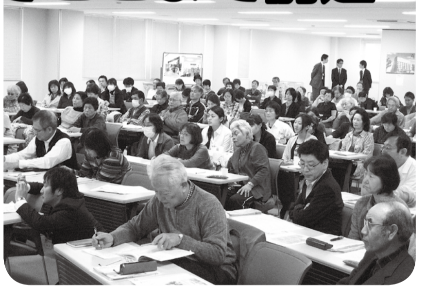
▲熱心に話を聞く参加者。