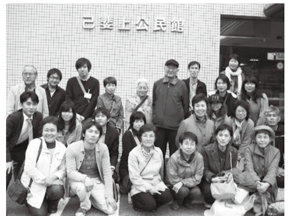
組合員さん宅訪問後に参加者でパチリ