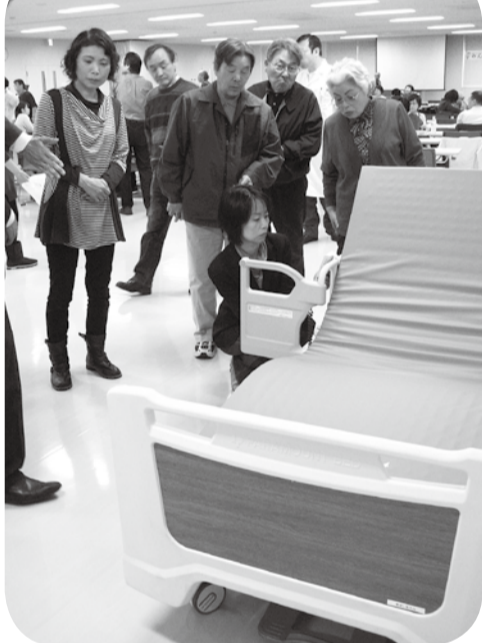
▲ベッド展示も行いました。