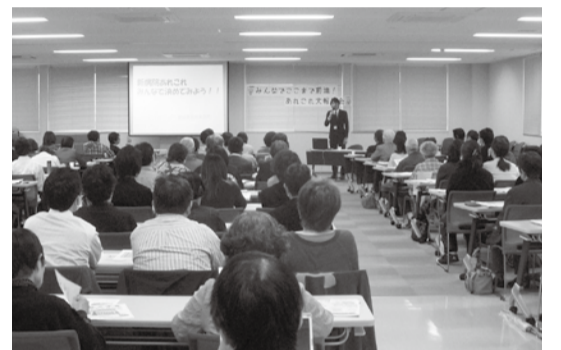
新病院詳細設計。みんなの知恵を集めよう。

重みがありました。当時をよく知る組合員の中には先生の話聞きながら終始「うん、うん。」とうなづかれたり、「当時は思い出し、涙が出そうになった」と言われた方も。