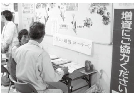
新病院建設に向けて頑張っています

福島支部では、第3木曜日を定例に、5月から福島生協病院内に「加入・増資コーナー」を設けて取り組みを開始しました。第1回目となった5月16日(休)は組合員5名、職員2名で行ないました。声かけをした成果は…なんと加入1件、増資8件(計13万8千円)。地元の支部ということもあり、知り合いがたくさんいる。やはりつながりが大事だとあらためて感じさせられました。