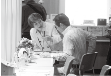
熱心に訴える森崎支部長

今年2月から始まった西部ブロックでの加入増資コーナー設置の取り組み。4月26日(金)からは「ぞうさんチーム」と命名して活動を新たに。理事2名、支部長3名で行った今回は、なんと2件の加入、6件の増資、1件の積立増資の申込がありました。同時に新病院の外観パス投票も行いました。