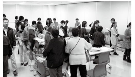
みんなで訪問に行ってきます。