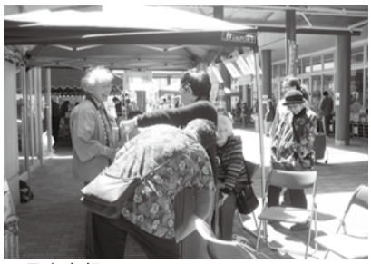
五日市支部 青空健康チェック