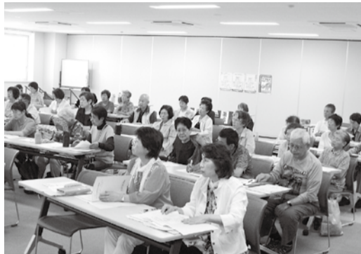
6月4日、中央ブロックはけんこうプラザで開催。