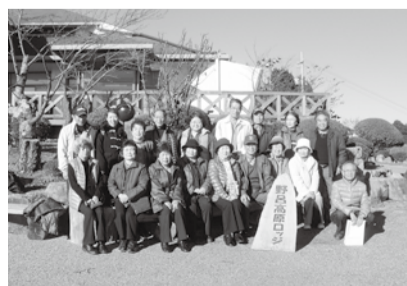
安芸中央支部 野呂山へバスハイク

支部の力をもっとつよくし、くらしと健康を大切にしたい助け合いの輪を私たちのまちにひろげましょう。