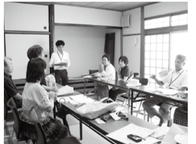
汗をかきながらの報告でした

予定していた訪問先を全部まわって達成感がありました」などの感想があり、みんな汗をだらだら掻きながらの報告ではありましたが、どことなくすがすがしさがありました。