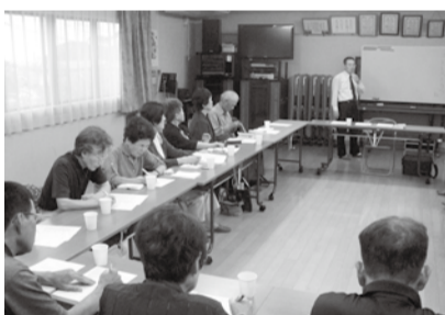
田方支部 健康講座「ストレスとうつ」についての学習