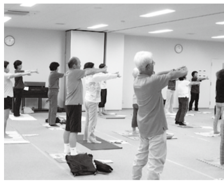
第1回目はストレッチを行いました。

6月19日(水)13時30分より、運動サポーター養成講座(全4回講座)を開講しました。初回は看護学生2名を含めて27名の参加がありました。