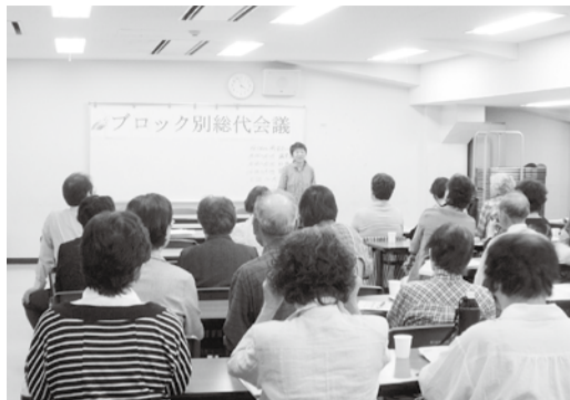
6月3日、西部ブロック会議の様様。

りをおこなう大事業をやっつけなければならぬ。今後とも皆様方のご協力が無ければ到底全うすることが出来ない大事業です。歴史に残る組織建設運動をさらに盛り上げ