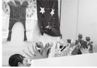
「こぶとりじいさん」の人形劇で楽しみました

この日、のびのびクラブが始まって3ヶ月…ついに「班」ができました! 4組のお母さんたちが集まって広場のおもちゃを利用して楽しく過ごす予定です。