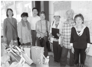
今から訪問に行ってきた～す

訪問58件、対話26件、うれしい事に加え2件、増資1件、積立増資の申込1件がありました。加入して下さった方が、早速お友達2人を紹介して下さりました。人と人とのつながりを大切にしたいと思います。