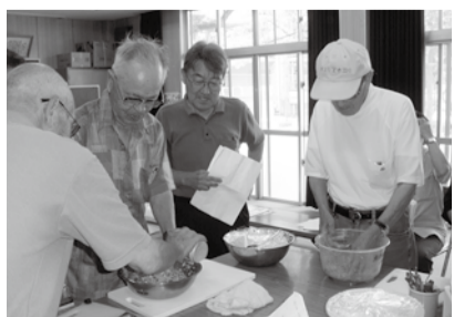
南区東支部 男の料理教室を開催