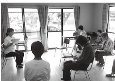
井口・鈴ヶ峰支部 転倒予防体操

今年度は、新病院着工の年です。地元支部としても今まで以上に組合員さん訪問に積立増資にと力を入れていきます。そして病院をもっともつとみんなで利用しましょう。