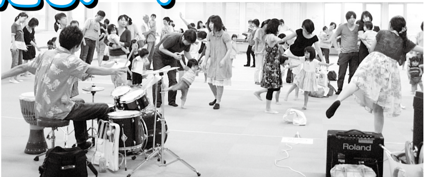
▲リズムに合わせて踊ろう