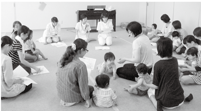
▲お母さんも勉強がんばるよ(子育て広場)