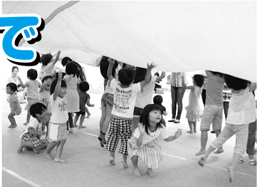
▲ブルーシートの海に潜ったよ