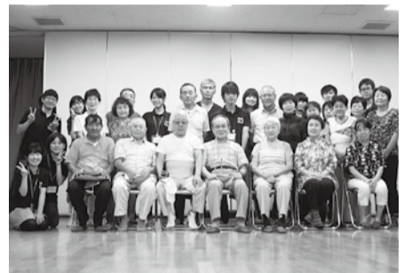
学生さんと地域の皆さんで

み続けられるまちづくりをめざしてがんばってまいります。最後にみんなで写真をパチリ！