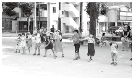
公園で思いっきりとんぼ飛ばしよ！