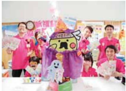
元氣いっぱいさえき病院

生協さえき病院では「明るく・楽しく・元氣よく」をモットーに職員一同、なかまふやし運動に取り組みんでいます。毎月25日の仲間ふやしデーには、楽しく声かけができるように、統一したユニフォームを着用している職場もあります。「どんな飾り付けが良いかな?」などと、組合員さんと相談しながら、患者さんが目で見て楽しめるアピールにも力を入れています。今年も、新病院建設に向けて職員と組合員さんが一丸となつて、仲間ふやし運動に取り組んでいきます。