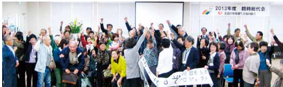
病院建設がんばるぞー

、映像コーナーで新病院への思いを膨らませた後、メッセージコーナーにて書き終えたらメッセージボードとともに記念撮影。写真は次回のももしもプロジェクトで紹介した後、病院へ掲示させて頂きます。