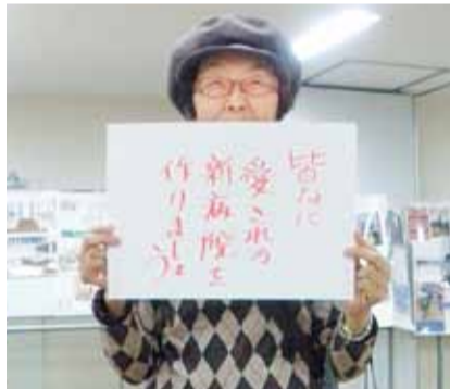
新病院へメッセージ