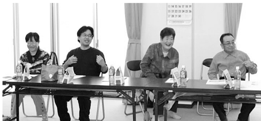
中区南支部 笑いヨガ