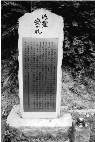
平成十年八月二日建立 金輪島原爆慰霊碑建立委員会

市民は熱線と放射能で即死、又は全身に火傷を負って逃げまどった。そのうち約500人位は金輪島に運ばれ暁部隊の方などに助けられ看護を受けた。負傷者は血だらけで、手をにぎると皮がつるとむけ、水をくださいと呼びながら、次々に恐怖と苦悶の中で息絶えたという。