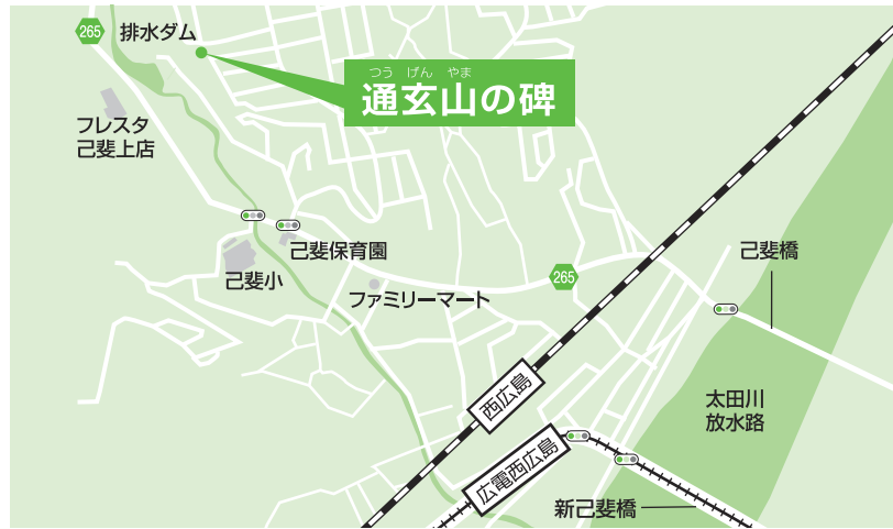
通玄山の碑 所在地:西区己斐中3丁目9番地

もっとわかりやすい道は、バス道路を己斐方向に進んで己斐上2丁目のスーパーの前に大きな排水ダムがあります。その排水ダムの背後が急な山になって木や草が茂っています。「通玄石」はその上にあります。どういう目的で碑を作ったのか、今になってはよくわかりません。