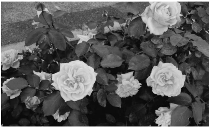
アンネの花壇 所在地: 広島市西区己斐上2丁目6