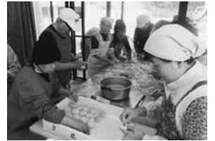
年末は餅つきを挙行了しました (サロン班・支部合同)

10年前、顔が見える支部活動をしたという思いから支部が結成されました。現在支部の運営委員6名(60代~80代)に担当理事を加えた7名で多彩な活動を展開しています。毎年組合員訪問に取り組み徐々に顔見知りが増えていく中で、組合員同士の交流発展の為にサロン班を作って欲しい!との意見がでました。主に交流目的のサロン班は年11回開催され、最大の特徴はもてなしではなく、参加者全員が企画、運営している事です。運営委員はサポートをします。内容は様々で季節の料理、手芸、希望の講座など、貪欲に何でも取り入れています。