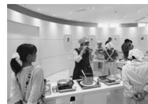
6/26アオハタジャムデッキでジャム作り (里山ウォーキング道草班)

次に健康づくりの基本、「歩く」をテーマにした班づくりがすすみました。「毎月1回の里山ウォーキングする班」、「毎晩50分歩く班」、「年間2~3回、車に分乗して出かける班」などです。活動資金づくりとして、ゴキブリ、ホウ酸団子の製作販売や町内会の祭りに出店するなどしています。