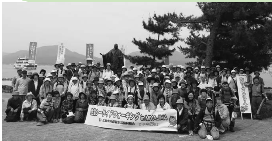
記念撮影 はいチーズ

5kmのコースは、序盤は左手に海、中盤は緩やかなアップダウンのある山道、終盤は誘惑たっぷりの参道を通ってゴールします。宮島の豊かな自然と人懐こい鹿と触れ合いながらウォーキングを楽しみました。お土産を口にしながらゴールする方もちらほら(笑)誘惑には勝てなかったかな?!