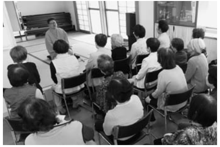
落語で笑いました