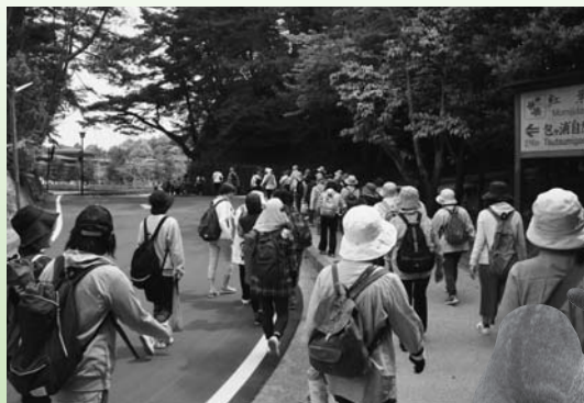
延々と列が続きました