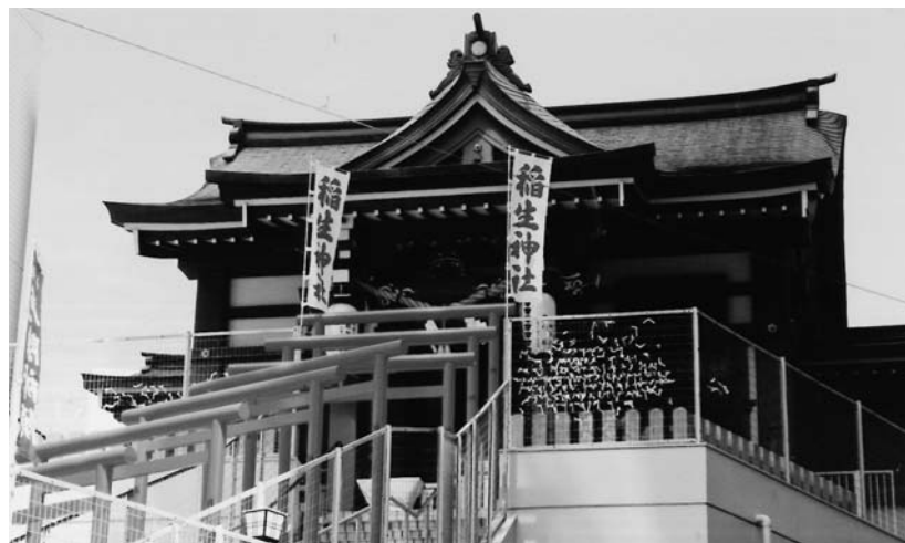
いなり 稲生神社 広島市南区稲荷町2-12

今も京橋川の稲荷大橋のほとりのビルの2階ベランダに神社があるという珍しい形のお稲生さんがここにある。