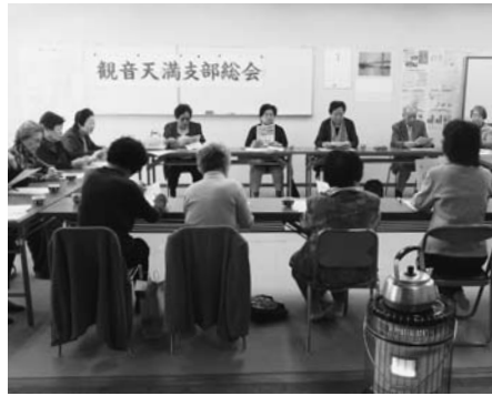
真剣に討論しました