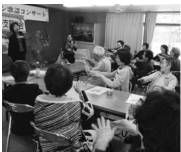
ウクレレと歌で合いました