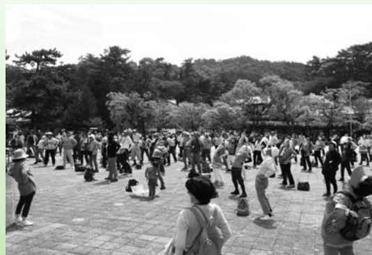
130名の体操に観光客もびっくり