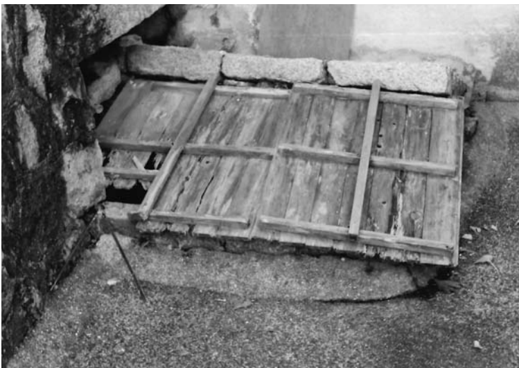
本川井戸 広島市南区堀越三丁目8