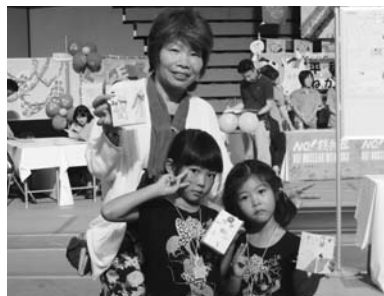
名古屋の孫と大阪から来ました

全国の生協が参加して毎年開いている虹の広場で当生協は「折り鶴づくり」と「灯笼づくり」のコーナーを担当しました。子どもから高齢者までひっきりなしに集まり、平和を願いながら作品を作りました。