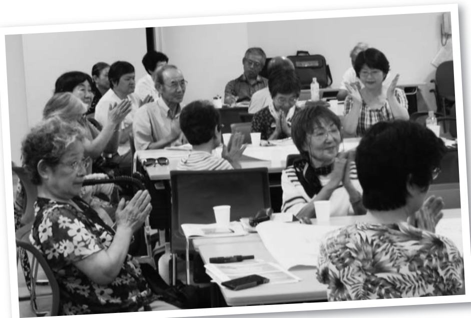
講演に聞き入る参加者

また、支部の実践報告として美鈴が丘支部と安芸東支部からも班会で楽しく活動している様子がいきいきと紹介されました。参加者からは「『居心地がいい』という医療福祉生協の魅力を実感することができました」などの感想が寄せられました。