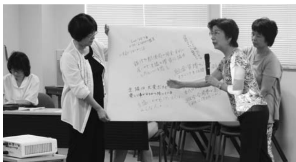
グループ発表のひとつ