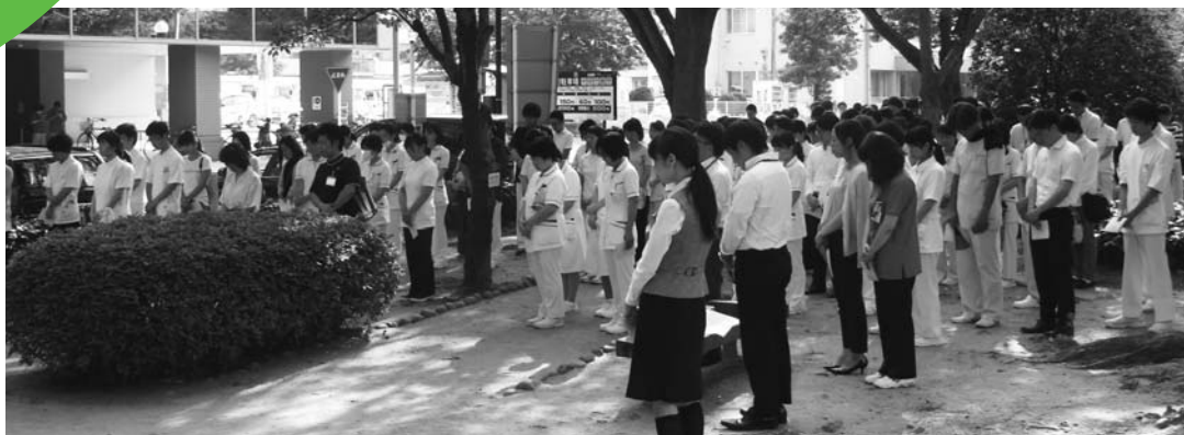
職員が黙とう(8月6日8時15分 福島地区慰霊碑前)