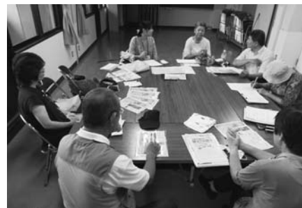
訪問前の打ち合わせ

8月26日、廿日市市四季が丘の組合員訪問を開催しました。組合員4名、組織部4名でペアを組み19軒(対話14件)のお宅を訪問しました。この地域で行う訪問は初めてということで、生協に加入されたきっかけなどもお聞きしたところ、ご家族の入院や健診受診のほか、近所の方に勧められてという方もいらっしゃいました。途中、豪雨に見舞われましたが、手配り協力者が2名、けんこうチャレンジの申し込みが2名という成果があり、みんなニコニコ笑顔で成果を報告していました。