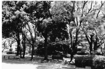
合併の森 百メートル道路西端、新己斐橋、東詰の南側