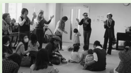
昨年の「のびのび」クリスマス会

広島中央保健生協うたう会「青い空」は2007年3月に誕生して今年でちょうど10年になります。「みんなですこやかな老後をつくる会」のメンバーの中から、何か歌がうたいたい、みんなで声を出したいとの思いが出され、老化防止、健康づくりにもつながると、月1度の集まりがスタートしました。