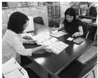
広島市教育委員会を訪問

組合員のみなさま まずはご自分、そしてご家族、ご近所に広め、健康寿命をのばしましょう!