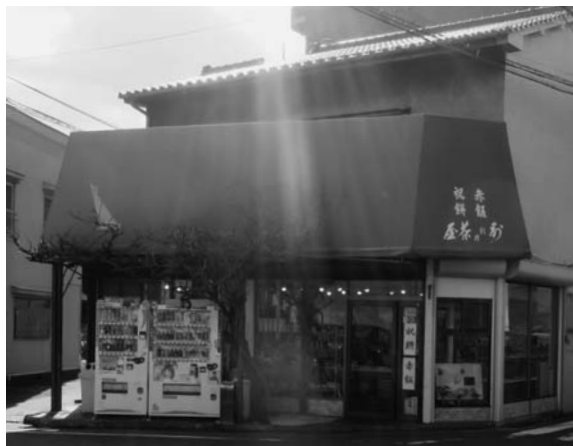
別れの茶屋 広島市西区 己斐本町3丁目9-11

今はパン、お菓子、手作りのヨモギ餅やキビ餅が売られており、人気の店となっている。