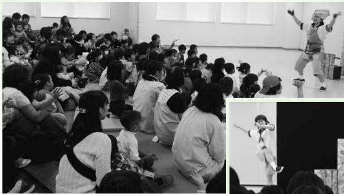
場内にはたくさん子どもたちで熱気あふれました

最後に、子育て広場や子育て班会、小児科、子ども食堂のご案内をして終了となりました。