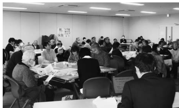
報告に熱心に聞き入りました

「職員や組合員、両方の報告がありよかった。」「職員は普段、支部の組合員に話を聞くことがほとんどないので、こういったあまり固くない交流会でいろんな話が聞けてとても楽しかった。」「花蓮班の皆さんの努力に感謝しました。光庭のイルミネーションは入院患者さんを癒してくれていると思います。」「昨年(以前)に比べ、活動・事業が多様になり、全体に運動と事業の前進を感じることができました。」などの