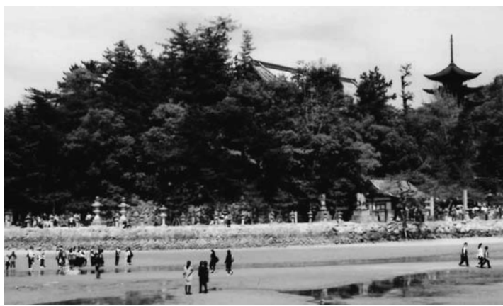
厳島神社 広島県廿日市市宮島町

厳島神社から対岸五重塔を望む。通常は浅い海が広がっているが、干潮時のみ干あがって砂洲になって人もおりられる。