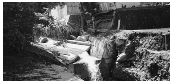
砂防ダムブロック倒壊