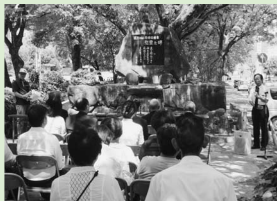
今年も行われた福島地区原爆犠牲者慰霊祭

私たちは今、当たり前のように平和な世の中に住んでいます。決して過去を忘れてはならないと思います。