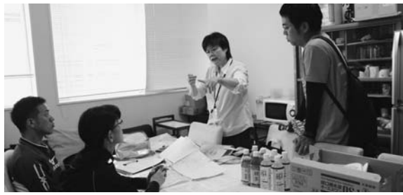
出発前の打ち合わせ

7月9日(月)以降、被害が発生したと思われる安芸東支部・安芸中央支部・東区北支部・南区支部での組合員訪問の実施について、担当理事・支部長と被災