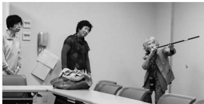
スポーツ吹矢から加入

でバスハイクなどのお楽しみ行事が企画され、月間後半でそのつながりを活かした仲間ふやしが進みました。八幡東支部ではあおぞら健康チェックでの加入、観音天満支部では吹き矢体験をきっかけにバスハイクで加入され、息子さんにも生協の活動を紹介したいと更なる加入につながったなど、活動のつながりによるうれしい成果が多くありました。また、今年度は名義変更による加入が進み、前年度月間中の名義変更9名に対し