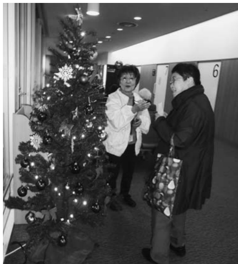
美鈴が丘支部の玄関行動

て今年度は25名の成果となりました。事業所では、月間中の加入数は351件で昨年の325件を大きく上回りました(前年比108%)。また組合員利用率にこだわりの、多くの職場で月間開始前より利用率を上げることができました。