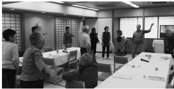
八幡東支部では数年ぶりのバスハイクで大盛り上がり

前年との比較では、仲間ふやしこそ上回ることでございますが、出資金増やし、積み立て増資者、班づくり、担い手増やしの取り組みで昨年を上回る成果を上げることができました。地域支部では、組合員ふやしの月間目標(各支部年間目標の8割)まであと22名に迫りました。前年比較では前年比82.5%にとどまりましたが、過去10年間で第3位の実績です。月間の前半は多くの支部