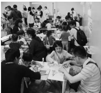
第2回開催時の様子

生協創立65周年、コープ五日市診療所開設25周年、生協さえき病院開設15周年記念行事生協周年記念行事