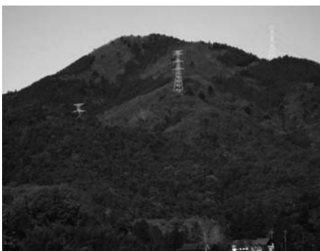
伏谷側からの東郷山

登山者によく登られており、24年前の広島国体では登山競技会場にもなった山である。登山道は伏谷(南側)からと和田(北側)からのルートがよく利用されている。