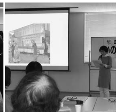
笑いケア道場の発表