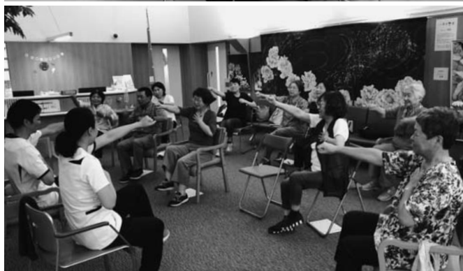
チャレンジ企画の様子