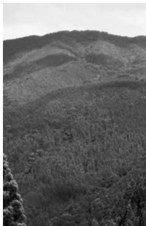
菅沢・栗柱から見た湯来冠山(中央が頂上)

静かな森の中に響く鳥と河鹿の鳴き声を聞きながら往路を下り、湯来温泉で汗を流したい。