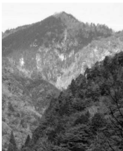
林道から見た頂上

旧湯来町と旧筒賀村の境界に位置し、集落からは見えない深い山である。湯来町麦谷・国原の一松寺前バス停から大草林道に入り、30分歩くと終点の100m手前の右手に登山道の標識があり急登が始まる。尾根を3回越して鞍部に着き、杉林に入り尾根に戻ると、林道に出る。林道を西に700m行くと頂上への登山標識がある。尾根道の急登を50分登ると頂上に着く(登山口から3時間)。頂上からは北に恐羅漢山、十方山(じっぽうざん)などが見渡せる。下山は往路を林道まで下り、100m東に歩いて右の尾根道に入る。樹林帯の中を下り、鞍部を経て小ピークから右に伸びる尾根を下って行くと滝に着く。煤井谷(すすいだに)を左岸と右岸を辿りながら下って行くとお宮に出る。林道を40分歩くと矢田ヶ原バス停に着く(頂上から3時間)。 湯来支部 牧野 一見