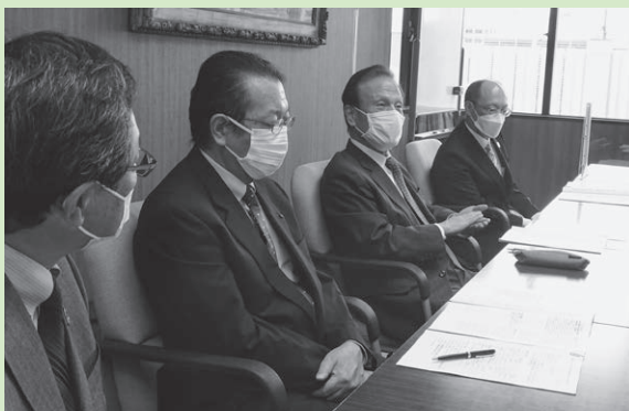
県生協連の出席者