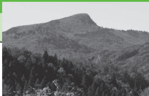
旧吉和村中心部から見た頂上