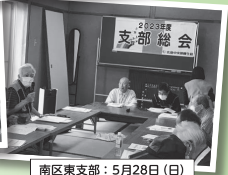
南区東支部：5月28日(日)