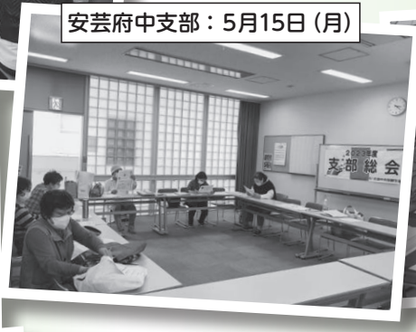
安芸府中支部：5月15日(月)