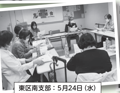
東区南支部：5月24日(水)