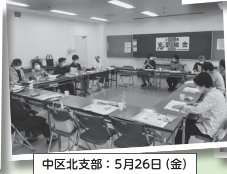
中区北支部：5月26日(金)