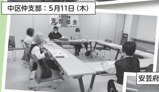
中区仲支部：5月11日(木)