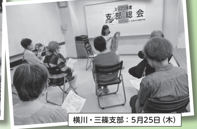
横川・三篠支部：5月25日(木)