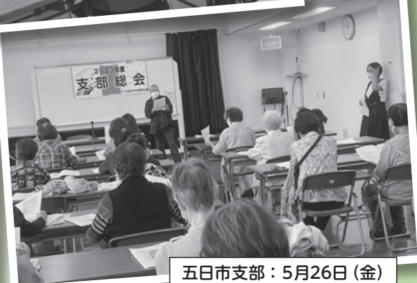
五日市支部：5月26日(金)