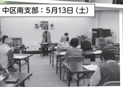
中区南支部：5月13日(土)