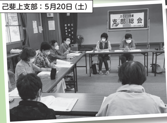
己斐上支部：5月20日(土)