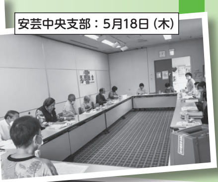
安芸中央支部：5月18日(木)