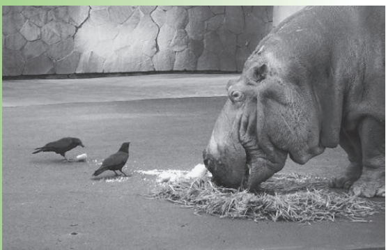
組合員さんが手作りの絵本を作ってくださいました！ 不定期にはなりますが連載していくので次回もお楽しみに♪

「カバとからすのおはなし」 ☆カバじいちゃん！ ★うん！なんだねークロちゃん ☆おじいちゃん、いつも くさばかり たべるのね！ ★うん！おにくはきらいなんだ！ ☆ふうん くさどのくらいたべるの？ ★そうだなあ！おおきないぬ いっぴきぶんくらいのおもさかなあ！ ☆へえ！そんなに、たべるの？ ★うん！どうぶつのなかで 4ばんめにおもいんだ ☆そうね！そのくらい、たべなくちゃーね！ ★それにクロちゃん、ぼくたちは ハナでおしゃべりするんだよ ☆へえ！そうなんだ、 いろいろ おしえてね！ まだまだ しらないこと、 たくさんあるので！ じゃーね！おじいちゃん、 またくるね！ バイーバイ！ かいた人…たちばな かをる