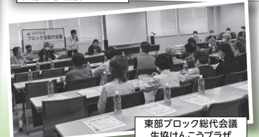
東部ブロック総代会議 生協けんこうプラザ