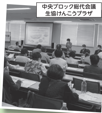
中央ブロック総代会議 生協けんこうプラザ

ブロック別総代会議だからこそ、気軽に質問や情報共有することができ、総代会議案を深める場となりました。