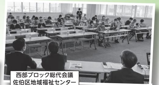
西部ブロック総代会議 佐伯区地域福祉センター